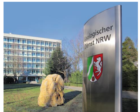
Geologischer Dienst NRW in Krefeld

Im Rahmen der Bodenuntersuchungen führen die Mitarbeiter*innen des Geologischen Dienstes NRW Sondierungen (Handbohrungen) bis maximal 2 m Tiefe durch. Stellenweise werden auch Aufgrabungen angelegt, aus denen Bodenproben entnommen werden.