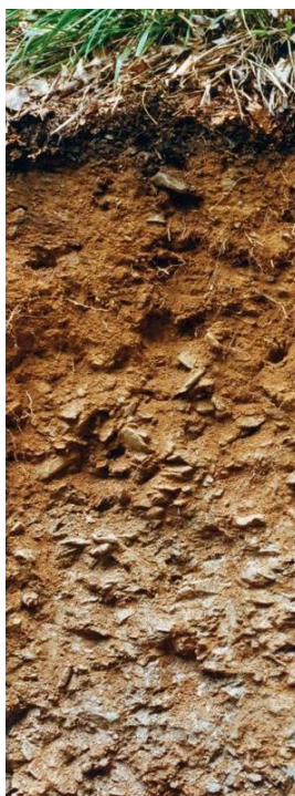
Braunerde (durch Eisenfreisetzung, Tonmineralbildung geprägt)