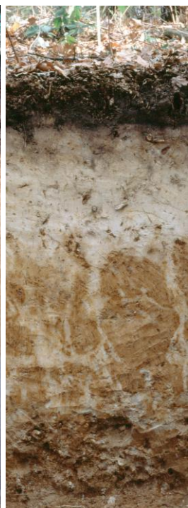
Pseudogley (durch Staunässe geprägt)