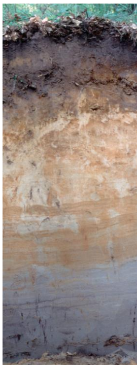
Gley (durch Grundwasser geprägt)