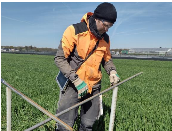
Beurteilung der Bodeneigenschaften durch den Geologischen Dienst

Demnach sind die Beschäftigten und Beauftragten des Geologischen Dienstes NRW berechtigt, Grundstücke – nicht die Gebäude – zu betreten und die notwendigen Arbeiten vorzunehmen. Auf forstliche und landwirtschaftliche Belange und die Nutzung der Grundstücke wird soweit wie möglich Rücksicht genommen. Falls trotzdem durch die Arbeiten Schäden entstehen, werden diese nach den allgemeinen gesetzlichen Bestimmungen ersetzt.