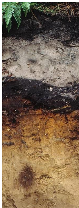
Podsol (durch säurebedingte Stoffverlagerung geprägt)