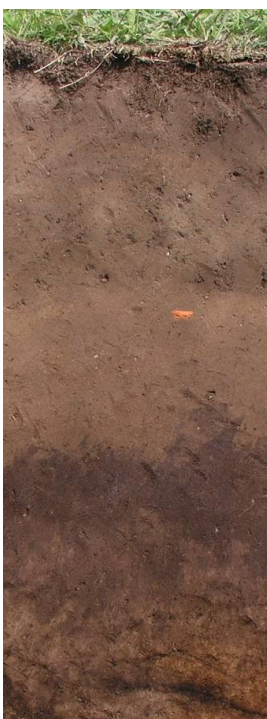
Plaggenesch (humoser Bodenauftrag)